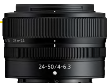
NIKKOR Z 24–50 mm 1:4–6,3