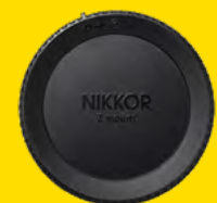
HINTERER OBJEKTIVDECKEL LF-N1