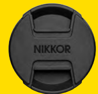
VORDERER OBJEKTIVDECKEL LC-52B