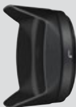
Bajonett- Gegenlichtblende HB-75 (mitgeliefert)