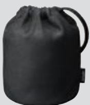
Objektivbeutel CL-1218 (optional)