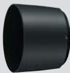
Bajonett-Gegenlichtblende HB-71 (enthalten)