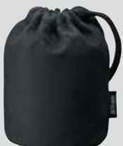
Objektivbeutel CL-1015 (enthalten)